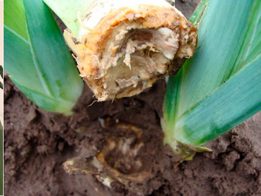
Бактеријска трулеж перунике