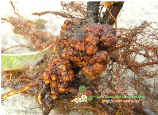
Тумор корена код дрвећа

Поред превентивних мера борбе постоје и директне мере борбе против ових болести.