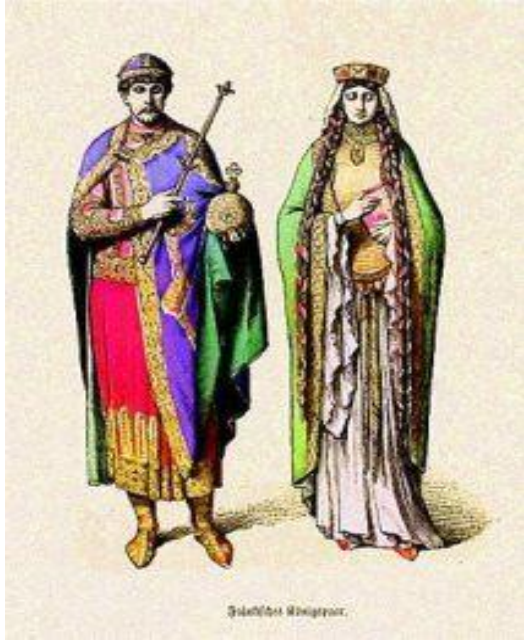
Краљ и краљица у средњем веку.