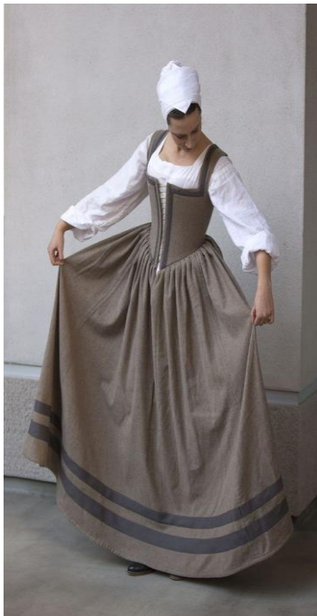
Грађанство, сељаци у средњем веку.